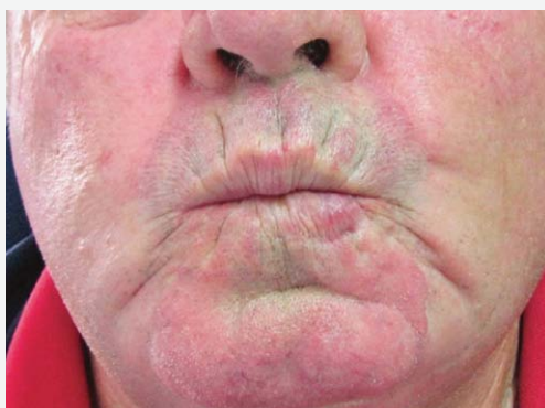
SLIKA 3. REZULTAT NAKON 3 GODINE POSLIJE OPERACIJE: A) ZATVORENA USTA, B) OTVORENA USTA, C) PRI ZVIŽDANJU FIGURE 3. RESULT 3 YEARS AFTER SURGERY: A) MOUTH CLOSED, B) MOUTH OPEN, C) DURING WHISTLING

prosječnog trajanja od 36 mjeseci nije zabilježen povratak bolesti. Boja kože i vermilion bila je postojana, a kasne strukturne komplikacije reznjeva u smislu kolapsa i kontrakture odsutne u svih bolesnika. Kod dvaju bolesnika koji su imali izraženi vermilion u centralnom dijelu zaostala je pojačana kontura kožne linije i vermilion, što se odrazilo na manju asimetriju u području usnog kuta (Slika 3 A, B, C).