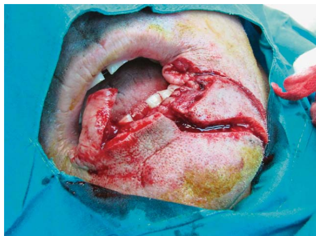
SLIKA 2. FORMIRANI ELASTIČNI REŽANJ VERMILIONA I OTOČNI V-Y MENTALNI KLIZAJUĆI REŽANJ LIJEVO

FIGURE 2. FORMED ELASTIC LOBE OF VERMILION AND ISLAND V-Y MENTAL ADVANCEMENT FLAP, LEFT