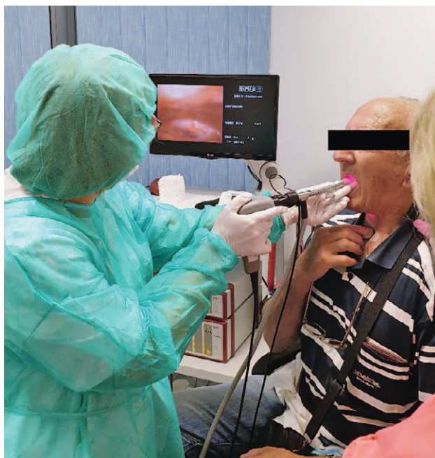
SLIKA 1. SNIMANJE LARINGEKTOMIRANOG BOLESNIKA KRUTIM ENDOSKOPIJOM SPOJENIM NA ULTRABRZU LARINGEALNU KAMERU FIGURE 1. RECORDING OF A LARYNGECTOMY PATIENT WITH RIGID ENDOSCOPE BEING ATTACHED TO LARYNGEAL HIGH-SPEED CAMERA

givanjem) vraća prema ždrijelu gdje nastaju vibracije u faringozofagealnom segmentu koje stvaraju zvuk koji se u usnoj šupljini artikulira u glas. Osnovna frekvencija takvog glasa je niska, a govor je isprekidan i kratkotrajan, zbog malog spremnika zraka u jednjaku, i uvelike ovisi o uvježbanosti bolesnika. 3 Usvajanje traheozofagealnoga glasa danas predstavlja zlatni standard u rehabilitaciji glasa laringektomiranih bolesnika, a postupak formiranja traheozofagealne fistule i postavljanje govorne proteze u literaturi su prvi put početkom 1980-ih opisali Singer i Bloom. 4 Govor nastaje prolaskom zraka iz pluća kroz traheozofagealnu fistulu u koju je postavljena govorna proteza. Tako potisnuti zrak uzrokuje vibraciju sluznice faringozofagealnog segmenta. Govorna proteza služi kao zalistak koji omogućuje jednosmjerni protok zraka prema jednjaku, a ne dozvoljava prolazak sadržaja iz jednjaka u dušnik i bronhe. 5 Tijekom godina različiti proizvođači stvaraju govorne proteze koje se razlikuju po veličini, duljini i materijalima od kojih su napravljene.