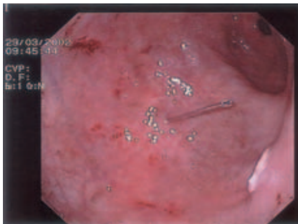
Slika 1. Metalni vodič u lumenu želuca (velika krivina distalnog dijela korpusa želuca) Figure 1. Guide wire in the stomach (great curvature of the distal corpus of stomach)

se postaviti gastrostoma) priprema se operativno polje (dezinfekcija kože i lokalna anestezija te incizija). Kroz prednju trbušnu stijenku, na mjestu incizije, uvodi se metalni vodič (slika 1) preko kojeg se uvodi plastični kateter, a mjesto ulaska kontrolira se endoskopom. Kroz plastični kateter uvodi se omča