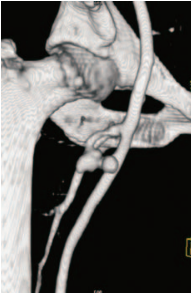
Slika 1. Rekonstrukcija MSCT angiografskog nalaza. Vidljiva je bisakularna pseudoaneurizma femoralne arterije.

Figure 1. MSCT angiography reconstruction. Bisacular femoral artery pseudoaneurysm is noticeable.