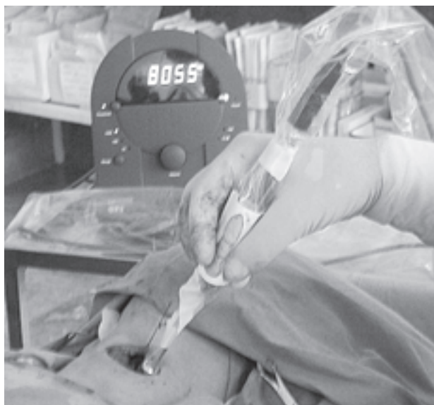
Slika 1b. Intraoperacijska sonda u sterilnoj navlaci na mjestu s najvećim brojem impulsa, a što se registrira na ekranu

Figure 1a. Preoperative ^{99m}\text{Tc} -SESTAMIBI scintigram – multiple views – 10 min (top row) and 80 min (bottom row) after injection of radiopharmaceutical. Uniform thyroid uptake with more intense focal uptake in the left upper lobe on early images. Late images demonstrate »wash out« from the thyroid, but intense focal uptake in the left upper lobe. On the oblique views it couldn't be separated from the thyroid lobe – intrathyroid localization was suspicious