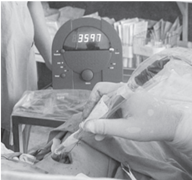
Slika 1d. Pad broja impulsa nakon odstranjenja adenoma Figure 1d. Decrease in number of counts after the removal of the parathyroid adenoma

Analizirajući scintigrame, odredili smo i tzv. indeks P/T (paratiroideja/štitnjača). 5,2 U omjer smo stavili broj impulsa u prikazanom adenomu PŽ i broj impulsa u štitnjači, i na ranoj i na kasnoj statičkoj snimci, promatrajući promjenu njegove vrijednosti.