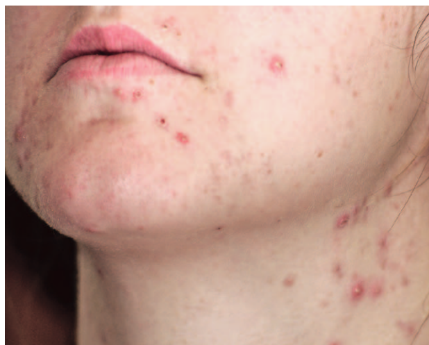
SLIKA 2. POGORŠANJE VEĆ POSTOJEĆE AKNE ZBOG OKLUZIVNOG UČINKA MASKE

Acne vulgaris jedna je od najčešćih dermatoloških bolesti i njena se patogeneza temelji na međusobnoj interakciji četiriju glavnih čimbenika: folikularne hiperkeratinizacije, povećanog stvaranja sebuma, upale i proliferacije bakterije Cutibacterium acnes . 27 No, kada govorimo o utjecaju nošenja zaštitne opreme, bitno je naglasiti da su kontinuirani pritisak na kožu i pojava trenja dokazani kao odlučujući čimbenici u etiologiji ovog tipa acne jer uzrokuju okluziju pilosebacealnih folikula u osoba koje otprije boluju od acne vulgaris (slika 2). 24 Nadalje, smatra se da nošenje maski s filterom (npr. maski N95) uzrokuje pojavu toploga i vlažnoga aerosola u predjelu lica koji je pokriven maskom, a takav okoliš idealan je ne samo za pojavu acne , nego i za brojne druge dermatoze. 15 Kod zdravstvenih radnika koji nisu imali dijagnozu acne vulgaris u svojoj