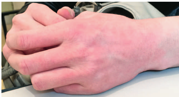
SLIKA 4. KONTAKTNI ALERGIJSKI DERMATITIS NA GUMENE ZAŠTITNE RUKAVICE