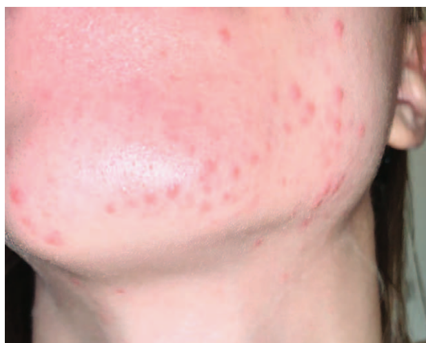
SLIKA 3. NOVONASTALA AKNE ZBOG OKLUZIVNOG UČINKA MASKE

FIGURE 2. AGGRAVATION OF PRE-EXISTING ACNE DUE TO THE OKCLUSIVE EFFECT OF A PROTECTIVE MASK