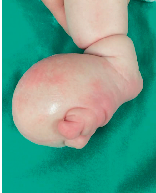
Slika 1a. Novorođenče u dobi od 12 dana, izgled desnog stopala Figure 1a. Newborn - 12 days old. The appearance of the right foot