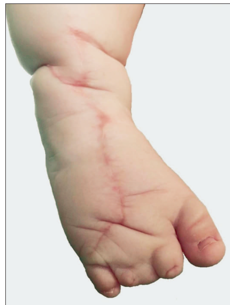
Slika 3. Zadovoljavajući estetski rezultat desnog stopala godinu dana nakon operacije Figure 3. Satisfying esthetic result of the right foot one year after surgery

dobro vaskularizirana te je nalaz isključio dijagnozu limfedema prisutnog u sindromu amnijske brazde. Zatim su magnetskom rezonancijom snimljeni stopalo i potkoljenica. Na snimci su promjeri potkoljenice iznad i ispod strangulacijske brazde bili gotovo podjednaki (4 cm), a na mjestu strangulacijske brazde potkoljenica je imala promjer od 2,3 cm. Promjena na dorzumu stopala (promjera oko 7 cm) opisana je MR-om kao limfedem, no nalaz je