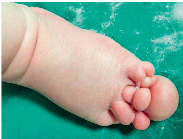
Slika 1b. Novorođenče u dobi od 12 dana, izgled lijevog stopala Figure 1b. Newborn - 12 days old. The appearance of the left foot

iz prve trudnoće zdrave majke koja je hospitalizirana u 19. tjednu trudnoće zbog povremenoga vaginalnog krvarenja. Trudnoća je redovito praćena, a ultrazvučna pretraga obavljena u 28. tjednu pokazala je povećanje desnog stopala fetusa. Nakon rođenja uočene su konstriksijska brazda iznad desnoga gležnja te lokalizirana kuglasta tvorba promjera 8 \times 8 cm. Stopalo nije bilo difuzno edematozno, a tvorba je pokrivala površinu dorzuma desnog stopala, dok prsti nisu bili otečeni (slika 1.a). Osim toga, novorođenče je imalo više strangulacijskih brazda i deformacije svih udova (obostrana sindaktilija te brahidaktilija šaka s vidljivim konstriksijskim brazdama na prstima). Amnijske brazde i njihove posljedice u obliku deformacija bile su prisutne i na prstima lijevog stopala (slika 1.b). Kuglasta, tvrda i jasno ograničena tvorba dorzuma stopala pobudila je sumnju na njezinu neoplastičku prirodu. Ultrazvučnim pregledom tvorba je opisana kao čvrsta, lokalizirana i