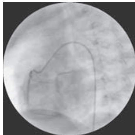
Slika 4. Desna koronarografija u dobi od 1 god. Osim blagog proksimalnog suženja sve su prethodne promjene nestale.

Figure 3. Right coronary angiography at the age of one month; there is a significantly widened ostium of the right coronary artery along with a dilatation of the right proximal coronary artery with a 90% proximal stenosis behind which a large baggy aneurysm can be seen. Behind the aneurysm is an 80% stenosis with a strong acute marginal branch or a collateral which is stenotic on the distal part, and from it stretch strong collaterals towards the left coronary artery. Fistula towards the right ventricle has completely disappeared.