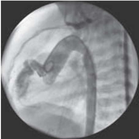
Slika 2. Aortografija (lateralna projekcija) u dobi od mjesec dana. Vidi se širok korijen i tortuotično proširenje desne koronarne arterije te punjenje desne klijetke. Jasno se prikazuje i plućna arterija kao znak velikog lijevo-desnog pretoka.

Figure 1. Doppler presentation of continuous flow in the right coronary artery (systolic-diastolic murmur). Pathologically enlarged right ventricle can be seen.