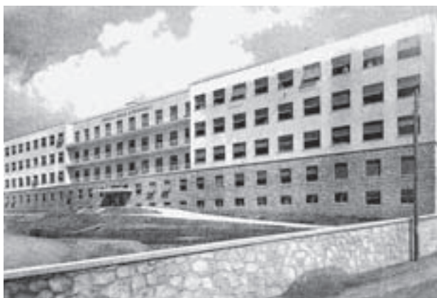
Slika 2. Zgrada Banovinske bolnice na Sušaku Figure 2. Building of the Banate Hospital in Sušak

skog primorja, Gorskog kotara te otoka Krka, Raba i Paga sa 143.086 stanovnika prema popisu 1931. godine,) radila 44 liječnika u Okružnom uredu za osiguranje radnika i u privatnoj praksi. Prema tome na ovom je području radilo tada ukupno 59 liječnika, pa je na jednog liječnika dolazilo 2425 stanovnika, što je za tadašnje doba bio iznimno dobar prosjek.