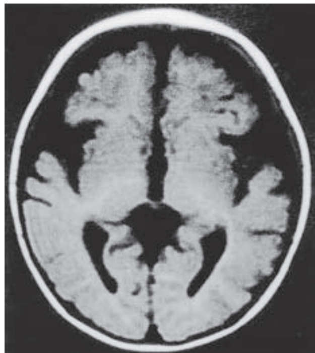
Slika 3. Magnetska rezonancija mozga djeteta koje boluje od nutritivnog manjka vitamina B 12 . Značajna kortikalna atrofija u bolesnika 3, iz tablice 1.

Prema literaturi postoji nekoliko definicija prema kojima se na temelju laboratorijskih nalaza i/ili kliničke slike postavlja dijagnoza manjka vitamina B 12 , te još uvijek ne