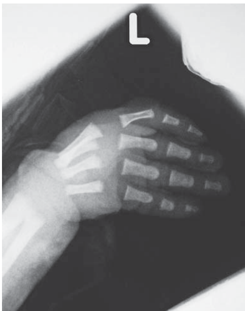
Slika 2. Radiološki prikaz aplazije palca lijeve šake i hipoplazije prve metakarpalne kosti

Figure 1. Thumb aplasia in a male newborn with Holt-Oram clinical presentation