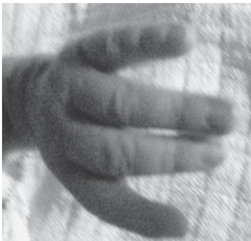
Slika 1. Nedostatak palca šake u muškog novorođenčeta s kliničkom slikom Holt-Oramova sindroma

Figure 1. Thumb aplasia in a male newborn with Holt-Oram clinical presentation